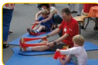
Kinder und Fitness