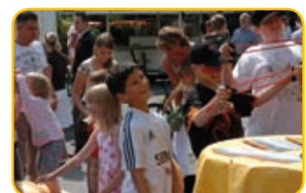
Spiel und Spaß